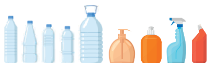
Bouteilles et flacons