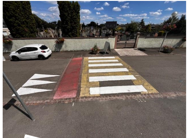
Marquage au sol