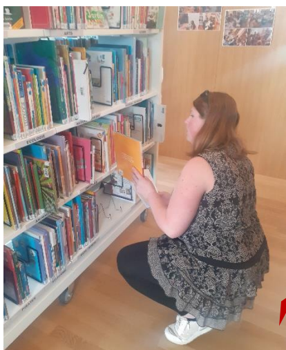
La recherche dans notre fonds