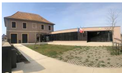
Mars 2022 - Numéro 141